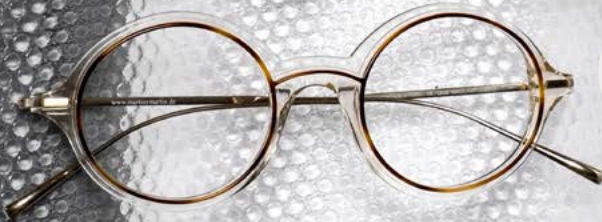
Ollie C.065 T & C.061 T