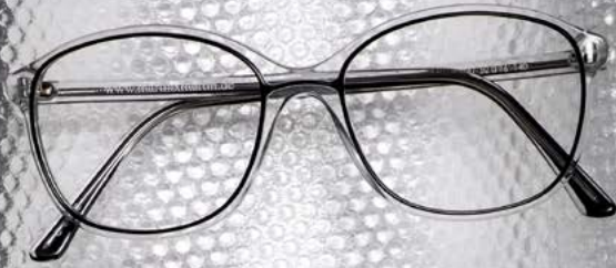
Vera C.600 & C.061