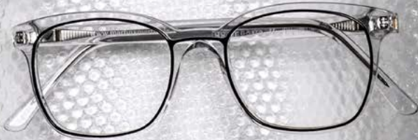
Jon C.601 & C.071