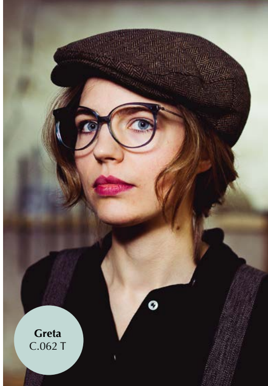
Greta C.062 T