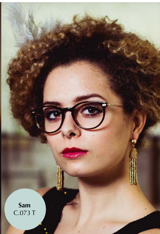
Sam C.073 T